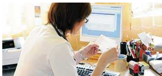
Ärzte nutzen ihre Praxis-PC sehr intensiv - insbesondere für die Verordnung von Arzneimitteln.

Die Preissensibilität der niedergelassenen Ärzte bei der Verordnung von Arzneimitteln ist innerhalb von nur einem Jahr deutlich gestiegen. Im Jahr 2006 gaben noch 33 Prozent der Mediziner an, Arzneimittel in Arzt-Informationen-Systemen oft über den Preisvergleich zu suchen. Im laufenden Jahr sind es bereits 45 Prozent. Das zeigt die "Marktanalyse Arzt-Informationen-Systeme 2007" (MAIS) der Agentur Schröder + Kern.